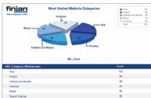
Muster des M86 Management-Reports