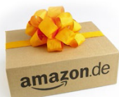
Amazon Gutschein Wert: 50,-- Euro 25 Punkte

Bitte beachten Sie, dass diese Aktion nicht mit anderen Rabatt-Aktionen, laufenden Bonusvereinbarungen oder erweiterten Projektpreisen der Aktions-Hersteller kombinierbar ist. Unser Vertriebsinnendienst gibt gerne Auskunft, ob gewährte Projektkonditionen der Punkteaktion gutgeschrieben werden können.