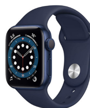
Apple Watch Series 6 (GPS, 40 mm) UVP des Herstellers: 418,15 Euro 210 Punkte