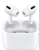
Apple AirPods Pro UVP des Herstellers: 210,-- Euro 105 Punkte