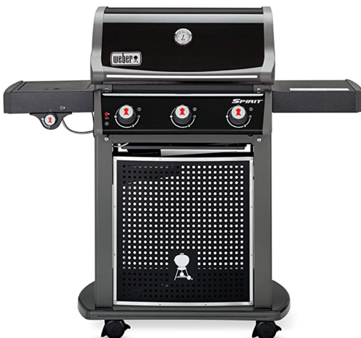
Weber Gasgrill Spirit E-320 Classic UVP des Herstellers: 749 Euro 375 Punkte