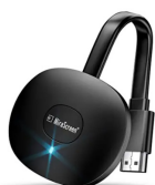
MPIO Wireless HDMI Display Dongle 4K UVP des Herstellers: 29,99 Euro 15 Punkte