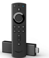
Fire TV Stick 4K Ultra HD UVP des Herstellers: 59,48 Euro 30 Punkte