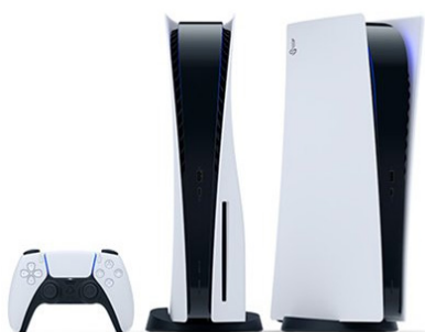
PS5 Standard-Edition UVP des Herstellers: 499,-- Euro 250 Punkte