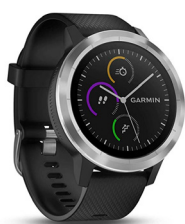
Garmin vívoactive 3 GPS-Fitness-Smartwatch UVP des Herstellers: 230 Euro 115 Punkte