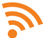
Gutschein WLAN-Ausleuchtung (remote Grundbetrag) 240,- Euro 120 Punkte