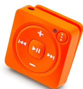
Mighty Audio Spotify Musikabspielgerät UVP des Herstellers: 91 Euro 46 Punkte