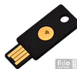
Yubico NEO UVP des Herstellers: 54,99 Euro 27 Punkte